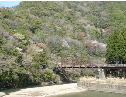
①小川口ジェット船乗降場 北山川と鉄橋に色とりどりクマノザクラが映えるビュースポットです。ツエノ峰の斜面にクマノザクラが多数見えます