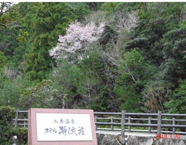
④瀬流荘前 トロッコ列車との撮影ポイント