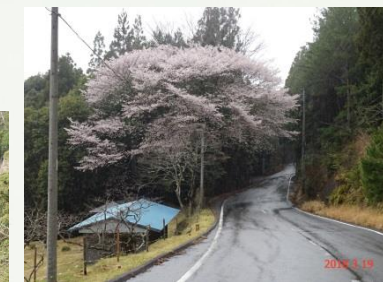
⑦田平子刑場跡近く 紀和で最大で、開花の期間が長いクマノザクラ