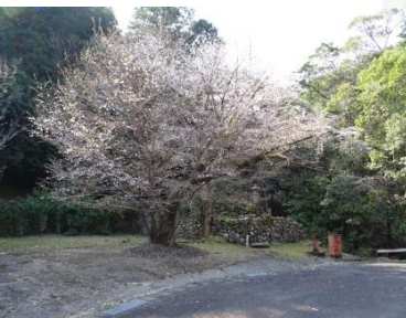
⑤楊枝観音(円通寺跡) 地元の人のていねいな管理もあって、太く朽ちた幹が歴史を語る老齢木