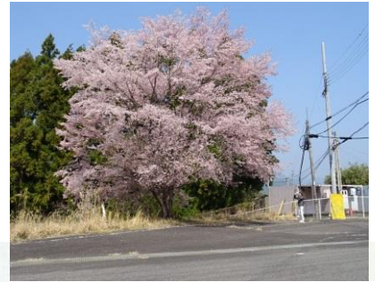
③長尾の西山電話局前 紀伊半島随一ともいえるクマノザクラ。濃紅色で紀和町の宝

103年ぶりに新発見された野生種のサクラ クマノザクラ Cerasus kumanoensis